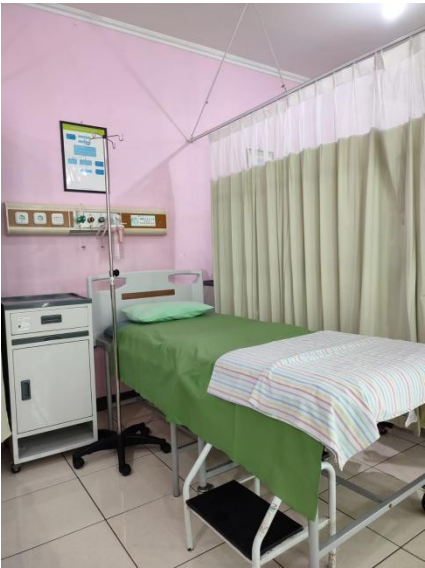
Ruang tindakan gyn: