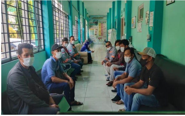
MCU PT Tiga Pilar Energi