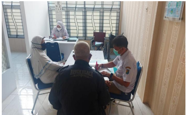
MCU Calon Jamaah Haji