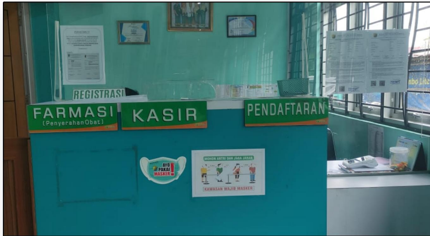
Pendaftaran, Farmasi dan Kasir ( One Stop Service )