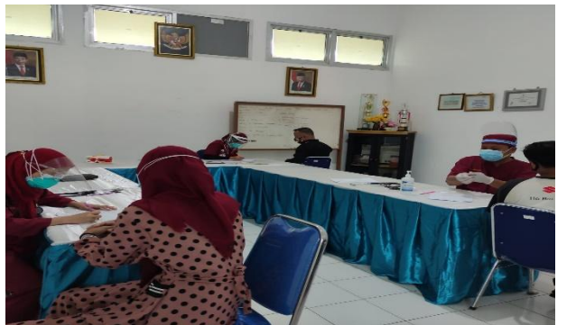
MCU PT Phillips Seafood Indonesia