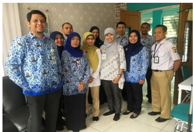
MCU CPNS menjadi PNS