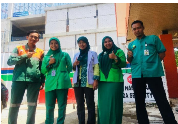
MCU WIKA Gedung Proyek Transmart