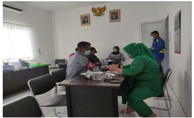
MCU PT Jaya Konstruksi