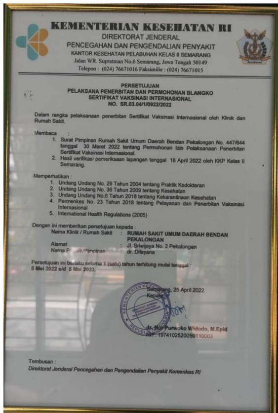
Sertifikat Penerbitan Vaksinasi internasional