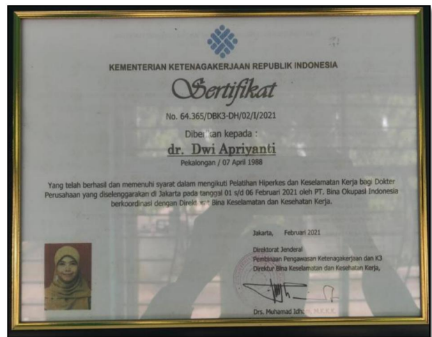
Dokter MCU Bersertifikat Hiperkes