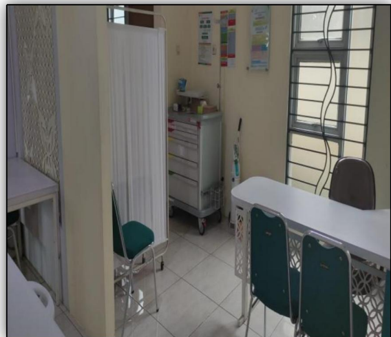
Ruang Pemeriksaan Dokter