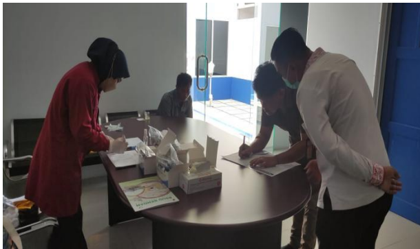
MCU PT SMJ Comal