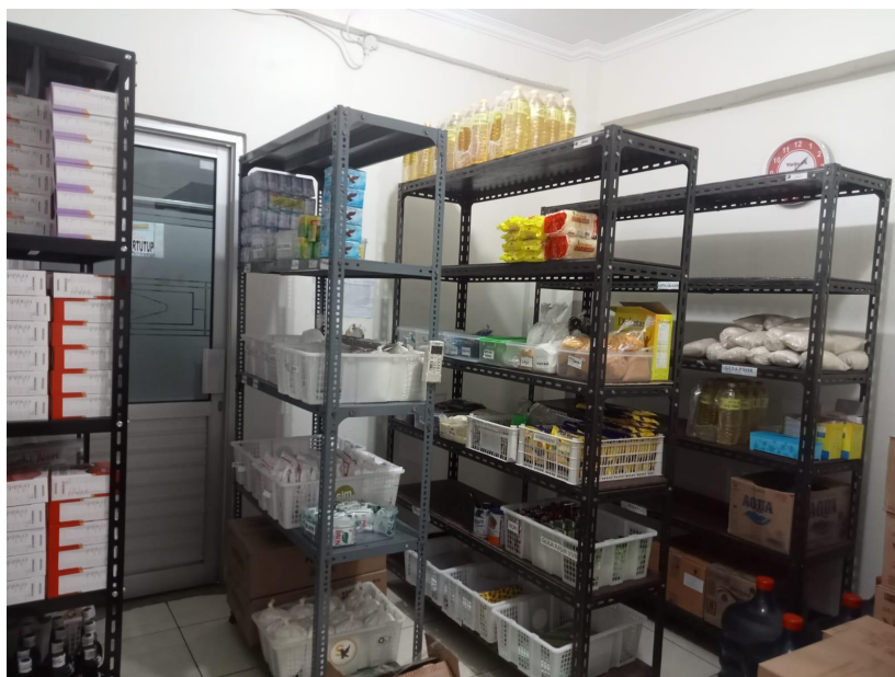
Ruang penyimpanan bahan makanan kering