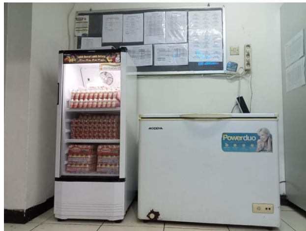
Ruang penyimpanan bahan makanan basah