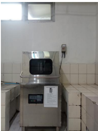
Ruang pencucian alat makan menggunakan diswasher