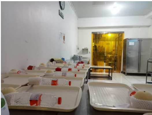
Ruang pemorsian dan distribusi