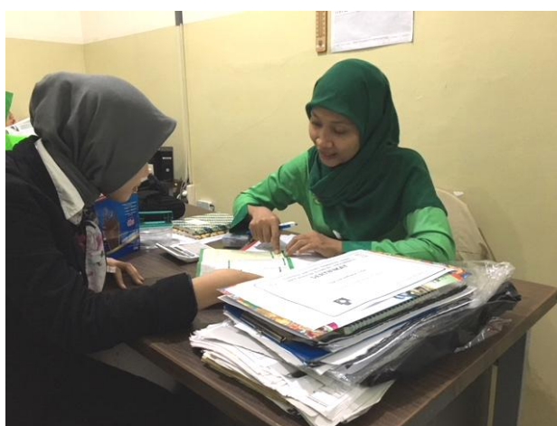
Konseling gizi rawat jalan